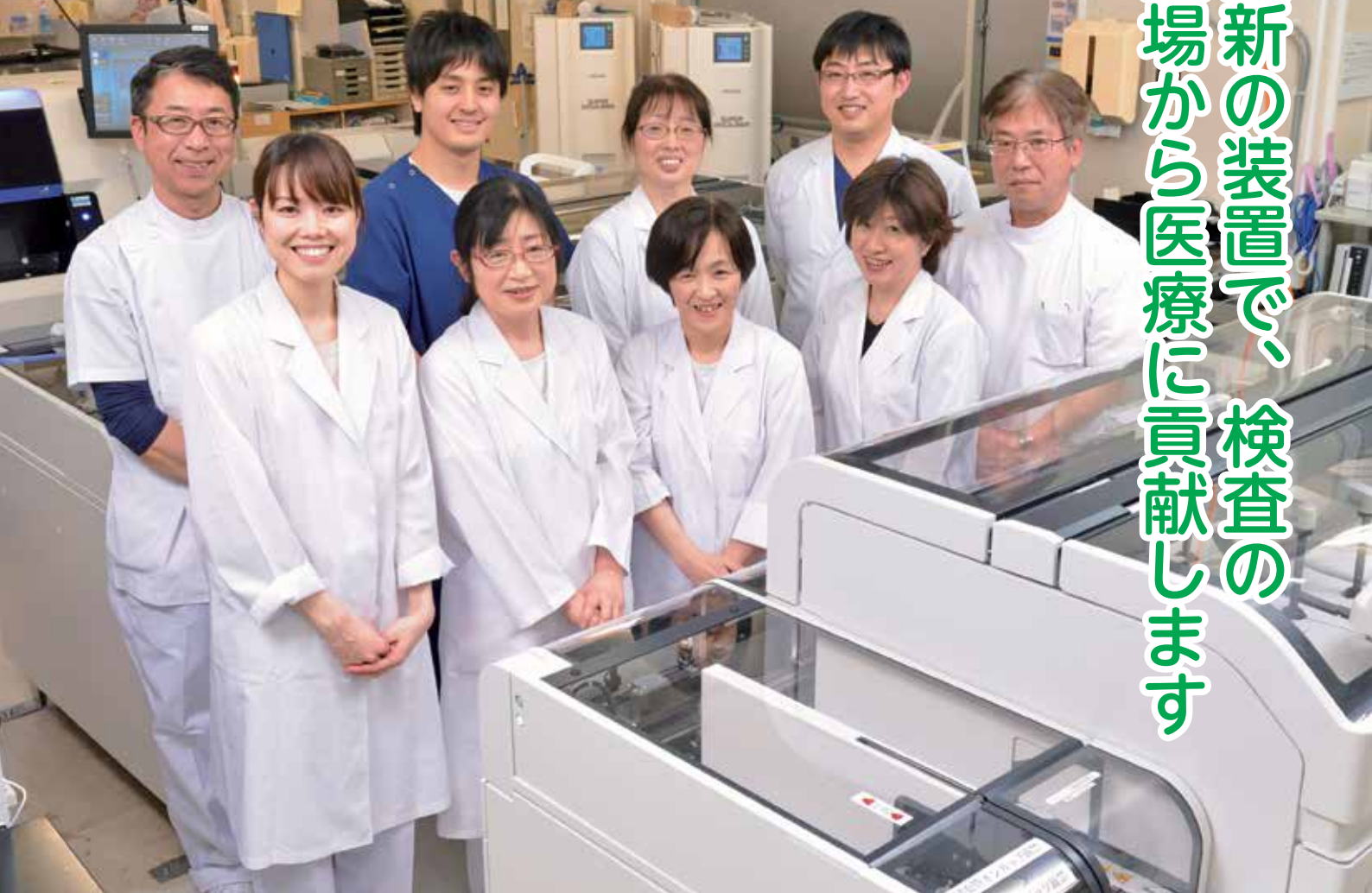
中央検査科スタッフ