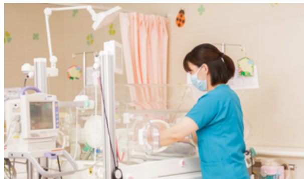
新生児集中治療室（NICU）

NICUでは週数が早く体重が小さく生まれた赤ちゃんや、呼吸が苦しいなどの症状がある赤ちゃんの診療を行っております。小さい赤ちゃんの診療は大変なことも多いですが、少しでも早く元気に退院できるように、スタッフ一同頑張っております。