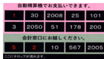
自動精算機と会計表示盤