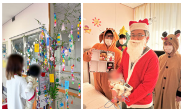
季節のイベントを開催

ほかにもイベントとして七夕のシーズンには病棟や外来に笹を飾って子供達の願いごとをつるしたり、クリスマスにはサンタさんが現われて入院中の子供達にプレゼントを配ったりします。