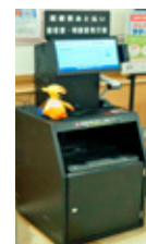
後払いサービス機

詳細については改めてお知らせします。また、当面は各箇所に職員を配置しますので、ご不明な点は遠慮なくお尋ねください。