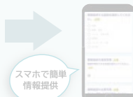
スマホで簡単情報提供